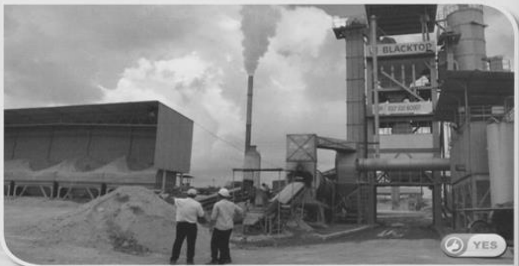
KUARI BLACKTOP INDUSTRIES SDN BHD DI SALAK TINGGI, SELANGOR